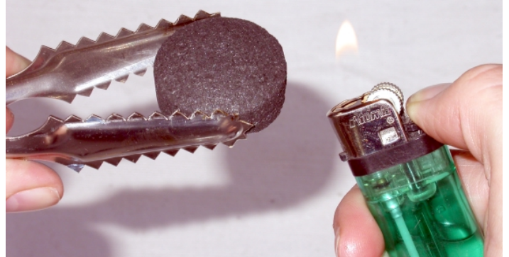
Selbstzündende Kohle anzünden

Für Wasserpfeifen sollte anfangs selbstzündende Kohle verwendet werden, denn dann ist das Anzünden ganz einfach: Das Kohlestück wird mit der Zange über eine Feuerzeugflamme gehalten, bis es sich entfacht. Wenn es durchgeglüht ist und nicht mehr raucht, wird es auf das Metallsieb oder die Alufolie über dem Tabak gelegt. Eine Kerzenflamme ist nicht geeignet, sie rußt zu stark und beeinträchtigt den Geschmack. Wichtig für die Entsorgung später: Die Kohlen können immer noch glimmen, auch wenn sie ausgebrannt aussehen. Kohlereste immer erst mit Wasser ablöschen, bevor sie weggeworfen werden! Für einen milderen Geschmack können Sie nach den ersten Versuchen normale Wasserpfeifen-Kohle verwenden.