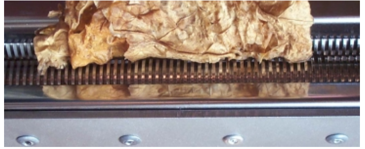
Schnittwalze mit eingelegtem Tabakblatt