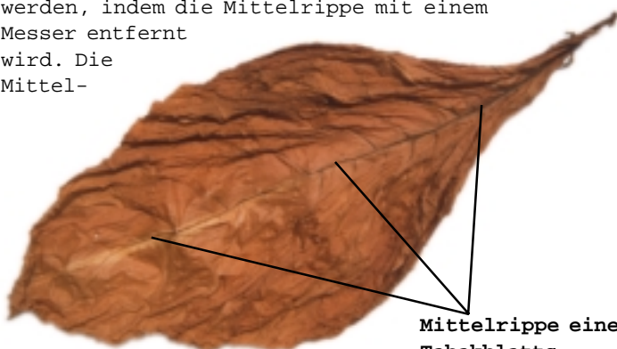
Mittelrippe eines Tabakblatts

Die Blätter müssen vor dem Schneiden entrippt werden, indem die Mittelrippe mit einem Messer entfernt wird. Die Mittel-