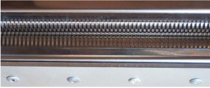
Schnittwalze der Tabakschneidemaschine